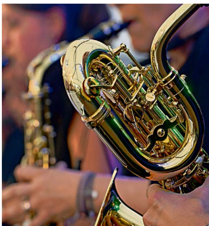
Satte Bläsesets, Salsaklänge und Partysound waren in Rümlang zu hören.